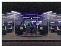
サイバーセキュリティソリューション