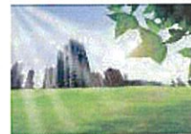
スマートエネルギー