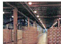
製造/物流/流通/サービス