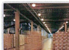
製造/物流/流通/ サービス