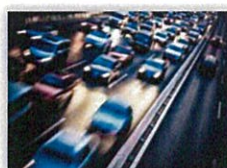
交通・都市インフラ