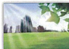
スマートエネルギー